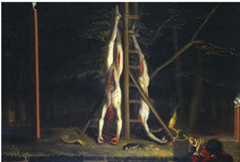
De lichamen van de gebroeders de Witt op de avond na de moord