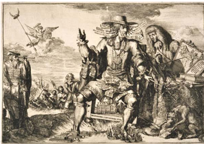
Romeyn de Hooghe, Anticurius van Loevesteijn

onenigheid tussen de officieren. Op pagina 15 tenslotte wordt nog eens heel duidelijk gemaakt dat het de commandanten zijn geweest die gefaald hebben. De legerleiding was niet goed voorbereid en durfde niet te handelen. De regenten komen er in dit pamflet nog goed van af, zij konden niets doen als het leger in zo'n staat verkeerde. 19 Toch zou dit juist kunnen bijdragen aan kritiek op de Witt en zijn regering. Want de commandanten werden wellicht gezien als Staatsgezinden, aangewezen door de Staten-Generaal en de regering. De eigen regenten en magistraten werden ontzien, omdat de door het centrale gezag aangestelde legerleiding faalde. Dus ondanks het feit dat het hier niet de regenten betrof zou dit de gebroeders de Witt niet goed uit kunnen komen. Dus of het nu de legerleiding was, of de regenten die als de schuldigen werden gezien, de mannen van de ware vrijheid zouden toch de grote boosdoeners blijven. Er is altijd een kop van jut nodig en het is gemakkelijk de schuld bovenin te zoeken. Daarom denk ik dat pamfletten over de val van verschillende steden ook zeker schadelijk waren voor de Witt, aangezien de misstanden die gemeld werden hem ook aangerekend konden worden, of dit nu terecht was of niet.