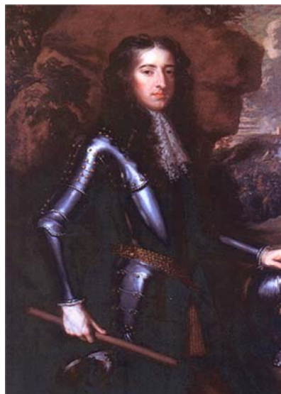
Stadhouder Willem III