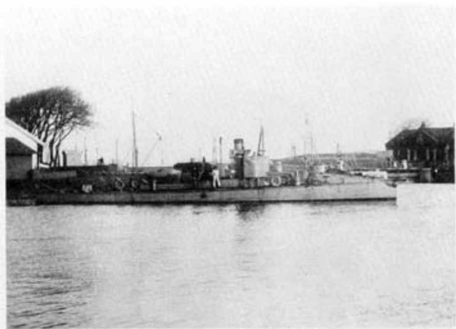
De torpedoboot "Christiaan Cornelis", op deze foto vermoedelijk liggend in de haven van Nieuwediep