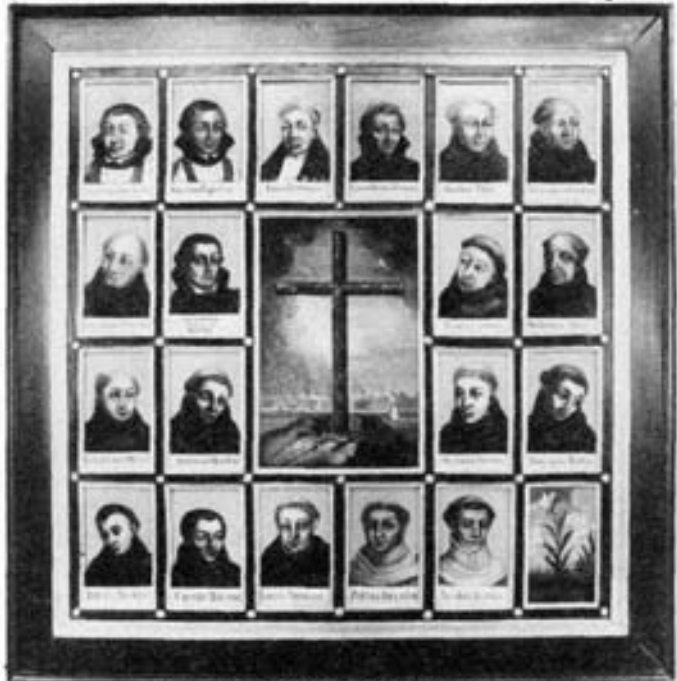
Het schilderstuk van de Martelaren van Gorinchem, dat nu op de tweede verdieping van het museum hangt

Zowel door de gehanteerde techniek, het onderwerp als de ouderdom, gaat het om een belangrijk kunstwerk, dat met hulp van de conservator Paul Dirkse, verbonden aan het Catharijne Convent in Utrecht, in Gorinchem is beland door het voor onbepaalde tijd aan "Dit is in Bethlehem" af te staan. Het schilderstuk heeft inmiddels een waardige plaats gekregen op de tweede verdieping naast de lithografie van de Martelaren.