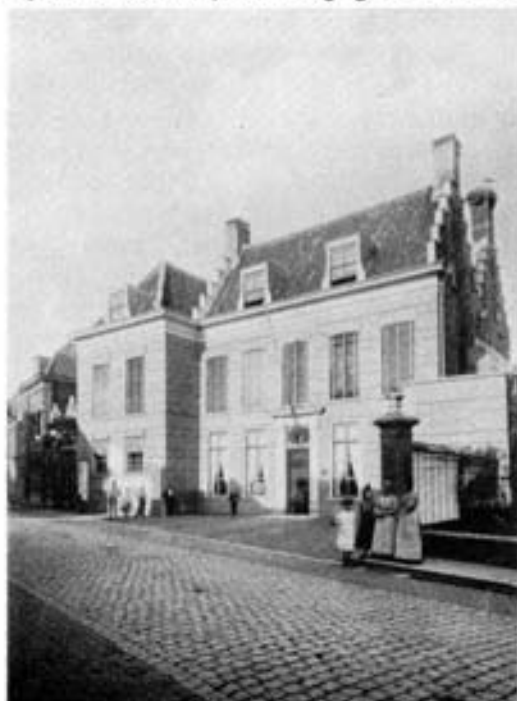
Het Doelengebouw in de Molenstraat, voorzien van de pleisterlaag die na de laatste restauratie gelukkig weer verdween (prentbriefkaart, begin 20ste eeuw)

Die Doelen, dat was iets moois. Je had het oude Doelengebouw, dat nu zo prachtig gerestaureerd is. Daar waren ver-