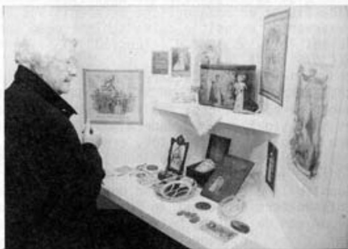
Een hoekje van het aan de regeringsperiode van koningin Wilhelmina gewijde deel van de tentoonstelling "Oranje Boven"

De tentoonstelling "Oranje Boven, drie eeuwen Oranje in de huiskamer" bestond uit herdenkingsvoorwerpen die te maken hebben met belangrijke gebeurtenissen rond het Huis van Oranje. De collectie besloeg de periode van ca.1680 tot heden, waarbij met name de periode rond 1900 sterk was vertegenwoordigd. De aanleiding tot het evenement was het 50-jarig-huwelijksfeest van prinses Juliana en prins Bernhard. De expositie, chronologisch per tijdvak ingericht vanaf stadhouder/koning Willem III tot koningin Beatrix, omvatte o.a. tegels, boeken, borden, prenten, lepels, oorkonden en fotokaarten. Er werden niet alleen zaken van nationaal belang tentoongesteld, maar ook het Gorcumse element was duidelijk vertegenwoordigd. Zo was er een serie fotokaarten