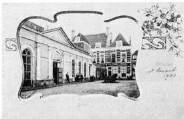
De Doelen aan de Molenstraat met links de concertzaal/bioscoop, gezien vanuit de tuin op een prentbriefkaart uit rond 1900