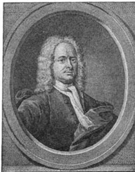
Simon van Slingelandt(1664-1736) gravure van Jacobus Houbraken, ca.1760

deur die de 'complaisance à outrance' betrachtte. Zijn kruiperige, vleierige en voor het Franse standpunt altijd positieve brieven konden onmogelijk als basis dienen voor een zakelijke en nuchtere evaluatie van de politiek van het hof van Versailles. Dit was des te ongelukkiger omdat het hierbij ging om een hof waarvan de medewerking in de ogen van Haar Hoog Mogenden toch van essentiële betekenis was voor het behoud en het veilig stellen van de vrede in Europa".