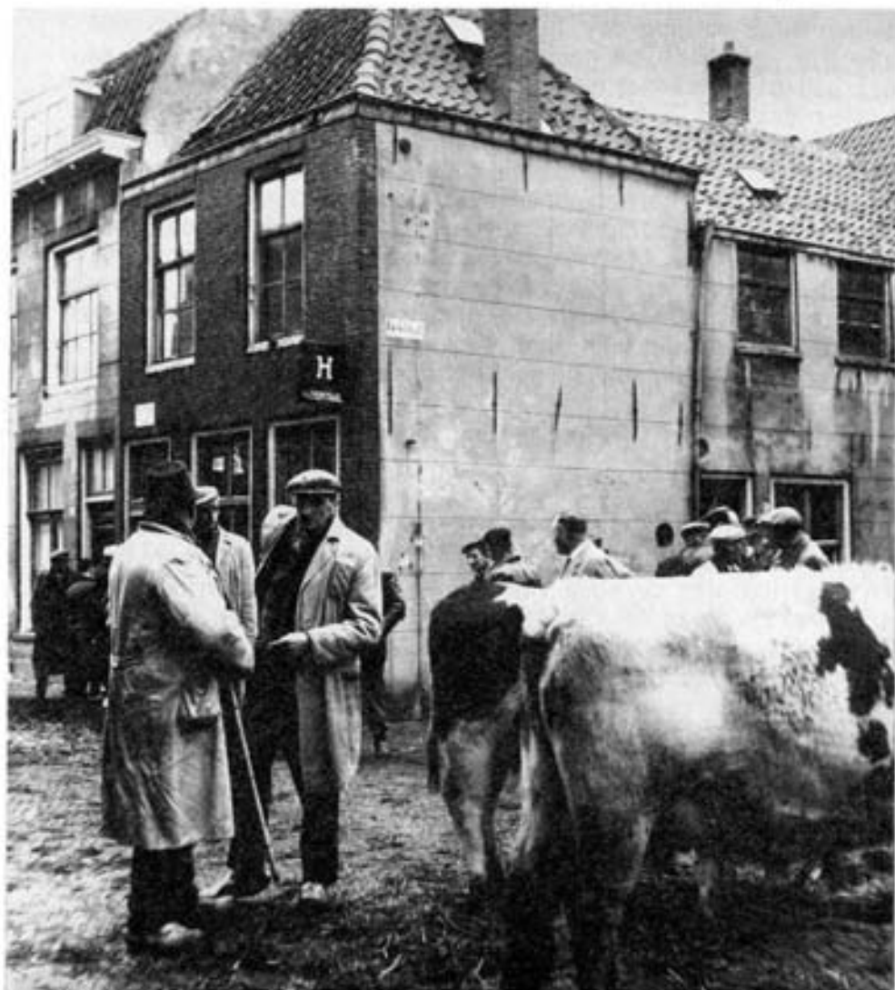
Veehandelaren met hun vee tijdens de Sint-Hubertusmarkt. Plaats van handeling is de Haarstraat-hoek Kwekelstraat