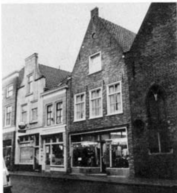
Het huis met de halsgevel - het derde huis vanaf de Kapel in de Arkelstraat - deed omstreeks 1770 dienst als postkantoor; de foto dateert uit omstreeks 1965

Het eigenlijke werk met betrekking tot de verzorging van de post werd gedaan door een commies. Zo was een zekere Hendrik Reems commies der posterijen in Gorinchem. Voor eigen rekening kocht hij in 1767 een huis aan de Arkelstraat om het als postkantoor te gebruiken. Het kostte hem f 900. Twee jaren later wist hij het Gemeneland van Holland en West-Friesland te bewegen het postkantoor over te nemen, waarvoor de commies toen maar liefst f 2.200 beurde. Het postkantoor was toen gevestigd in het huis met een halsgevel, genaamd "het Witte Kruys", zijnde Arkelstraat 36.