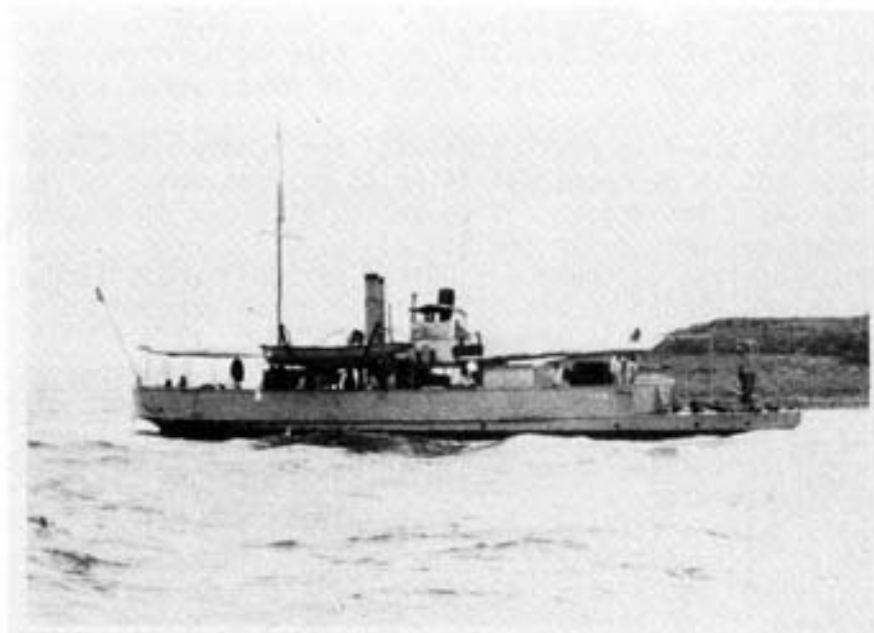
De "TYR" bij het verlaten van de haven van Den Helder